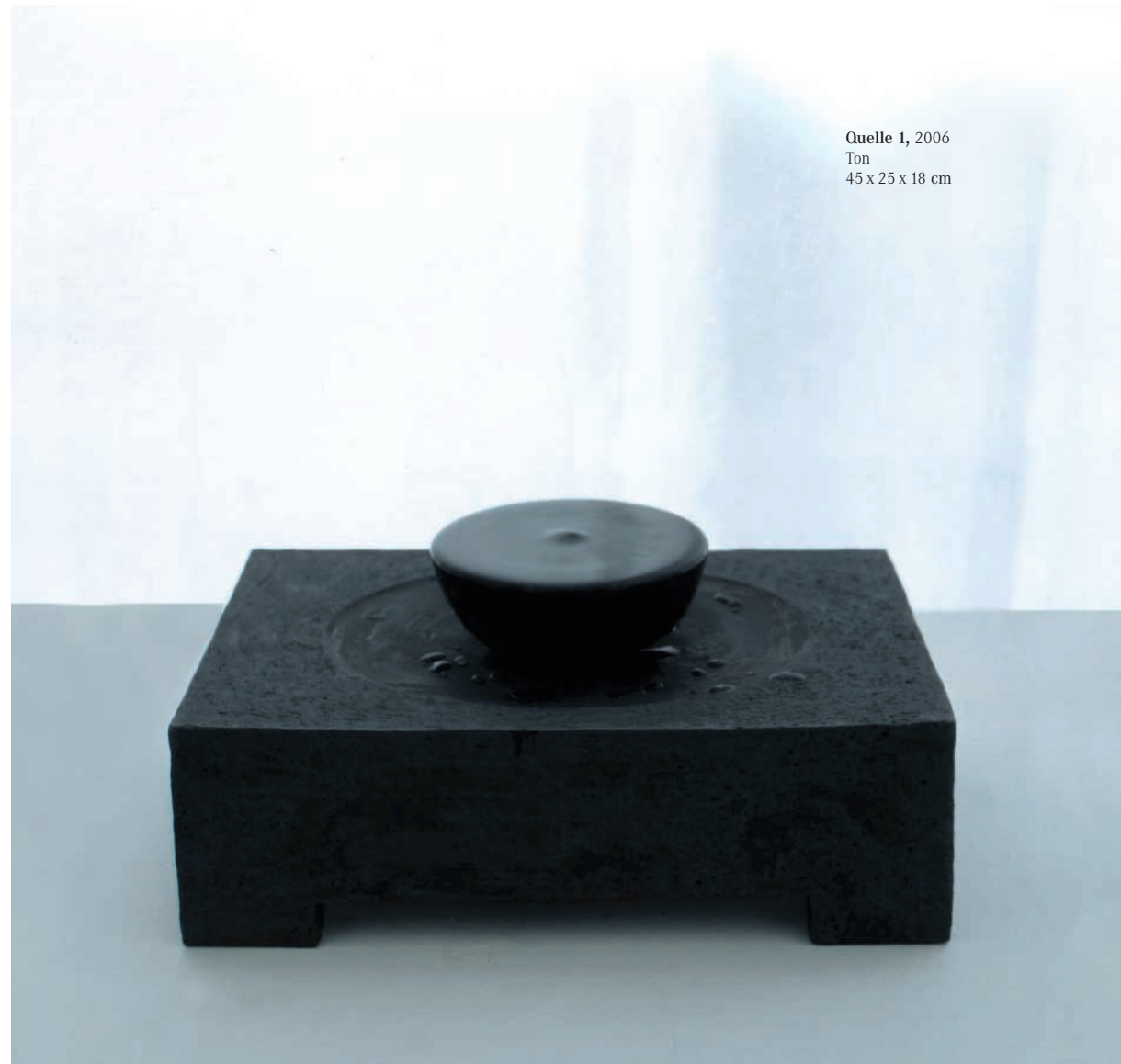
Quelle 1, 2006 Ton 45 x 25 x 18 cm