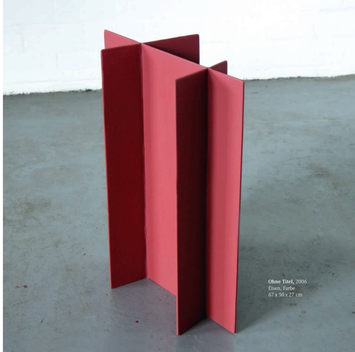
Ohne Titel, 2006 Eisen, Farbe 67 x 50 x 27 cm