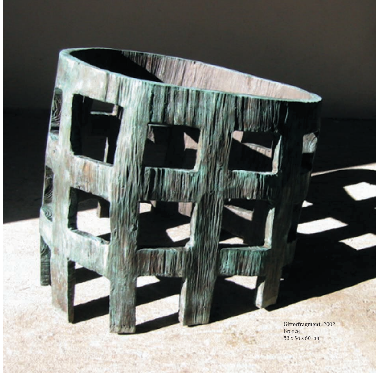
Gitterfragment, 2002 Bronze 53 x 56 x 60 cm