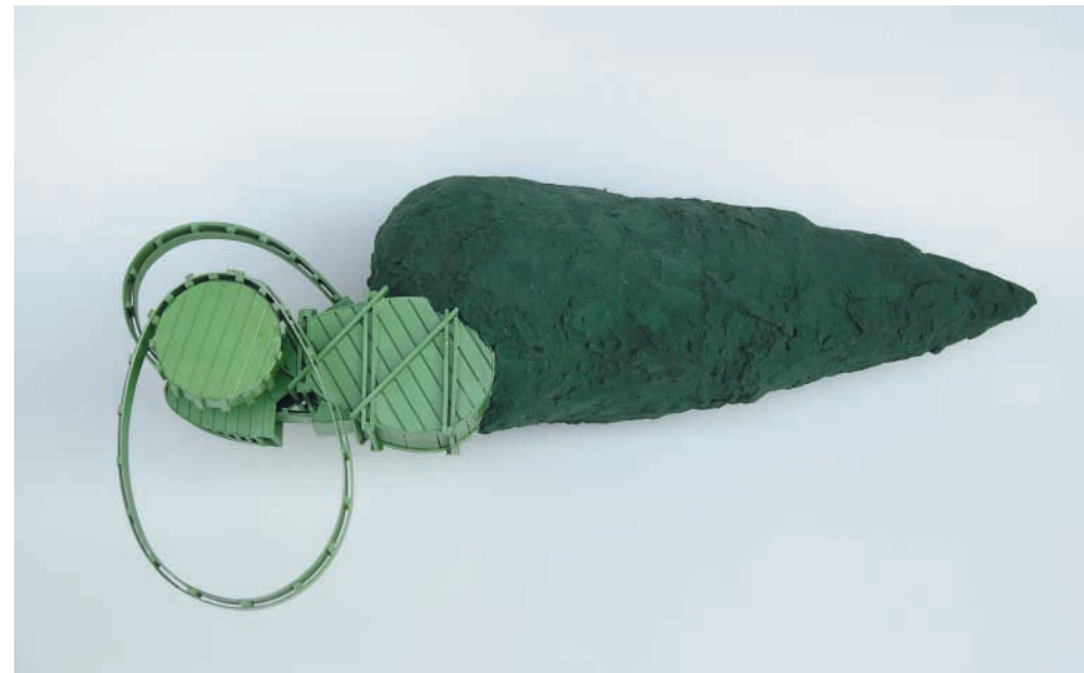
Laufband , 2004 Gips, Holz, Karton 85 x 40 x 26 cm